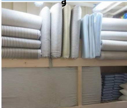
①ロッカーから運び出す