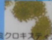
ミクロキスティス

大発生したプランクトンが湖水を緑色にそめる状態のことをいいます。原因となる主な植物プランクトンは、アナベナやミクロキスティス。特に、ミクロキスティスは、浮く力があり、大量に発生すると、まるで水面に青い粉をまいたか、ペンキを流したようになるのが特ちょう的です。