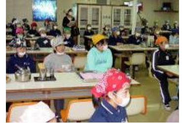
★説明は前を向いて聞きます

○食器などをトレーから出して、おひつ・なべ・やかんの周りにならべる。 <前半> トレーは「ピンク色のふきん」だけを残して机の下へ <後半> トレーは、からにして食堂入り口付近のたなに返す ※その他のからになったトレーなども、前のカウンターに返す