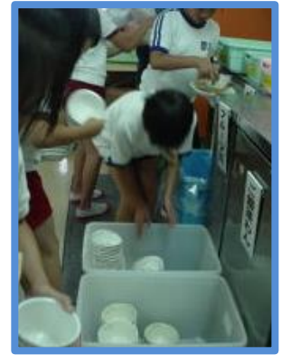
食器は決められたかごの中へ